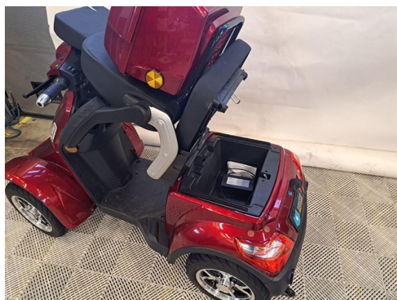
Nosta penkki ylös.