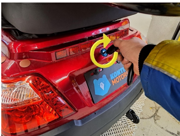
Avaa penkkilukko avaimella.